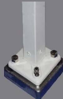
Mastfuss Typ B mit Bajonettverschluss