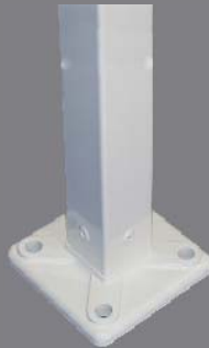
Mastfuss Typ A

Typ B: mit Bajonettverschluss, der eine unproblematische Entfernung des Mastes ermöglicht